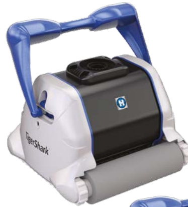
Versión cepillo de espuma