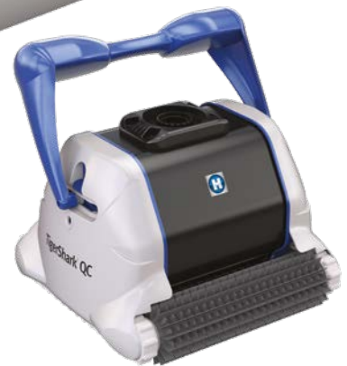
Versión cepillo de plástico